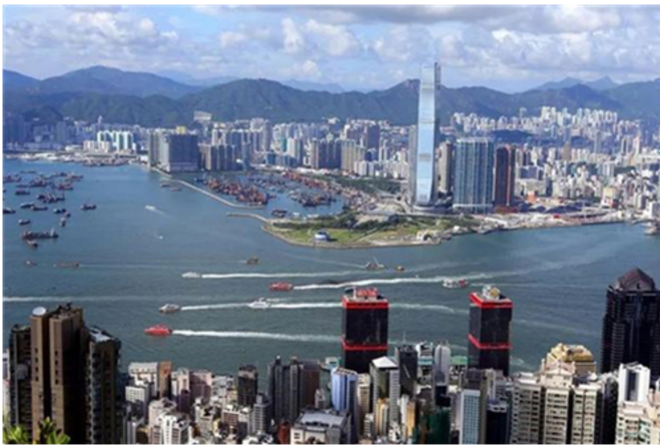
資料圖：香港上環港澳碼頭。新華社記者 李鵬 攝